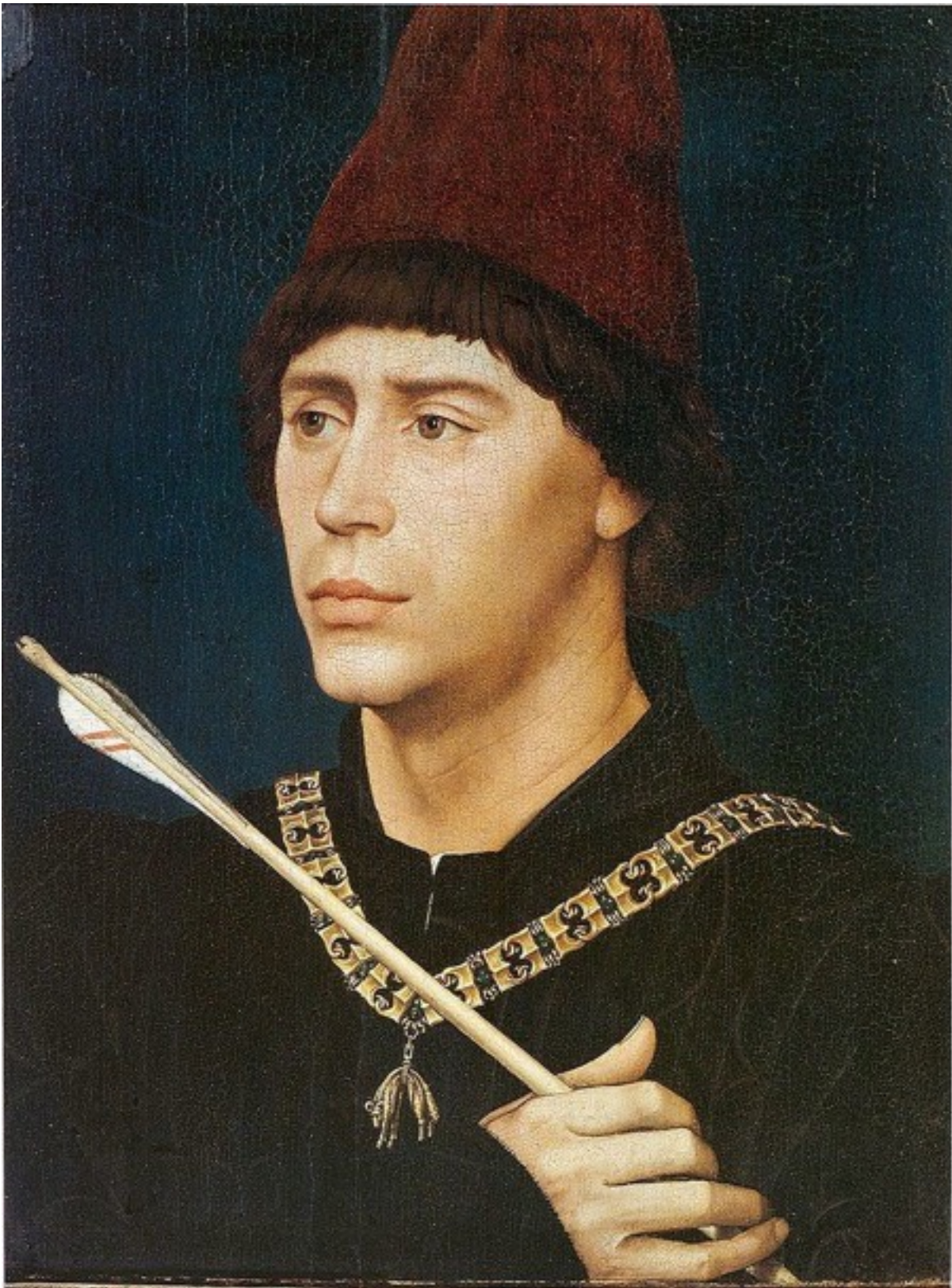
Portrait d'Antoine, Grand Bâtard de Bourgogne par Rogier Van der Weyden

Ce document se trouve en Italie, à Turin : les deux tomes de cet exemplaire ont été séparés en 1720 :